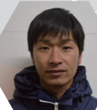
新立司 U-12 監督 D級指導者・3級審判